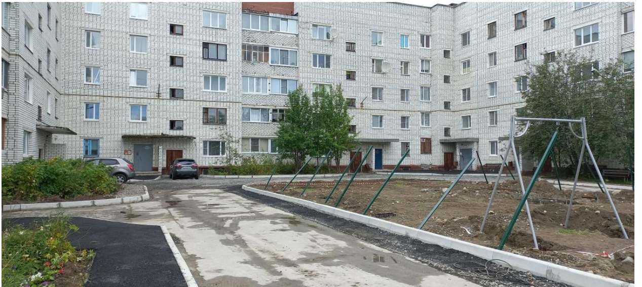
После проведения работ