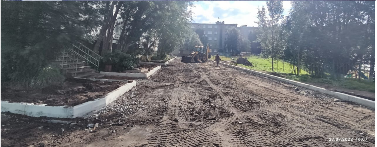
После проведения работ