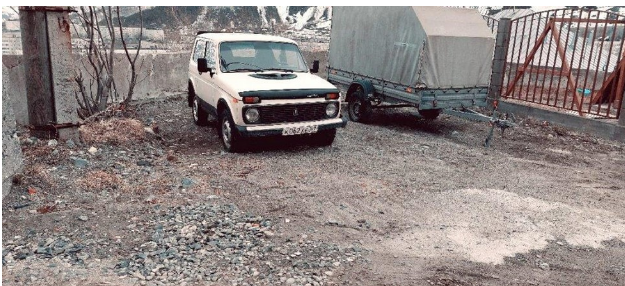
Ход выполнения работ и результат