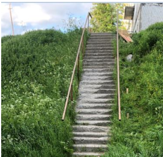
до проведения работ