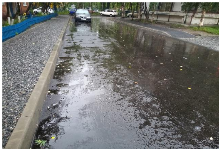
После проведения работ