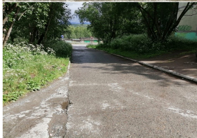
ул. Зиновьева д. 4 после окончания выполнения работ