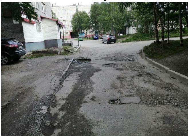
ул. Зиновьева д. 2 до начала выполнения работ