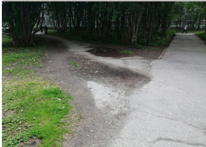
ул. Зиновьева д. 2 после окончания выполнения работ