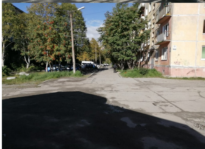
ул. Ферсмана, д. 25 после окончания выполнения работ