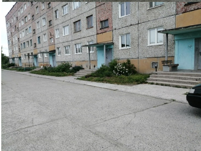
ул. Путейская, д. 7 после окончания выполнения работ