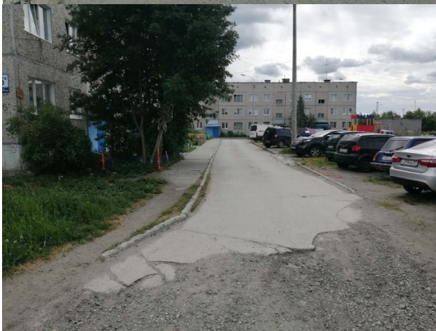
ул. Путейская, д. 5а после окончания выполнения работ